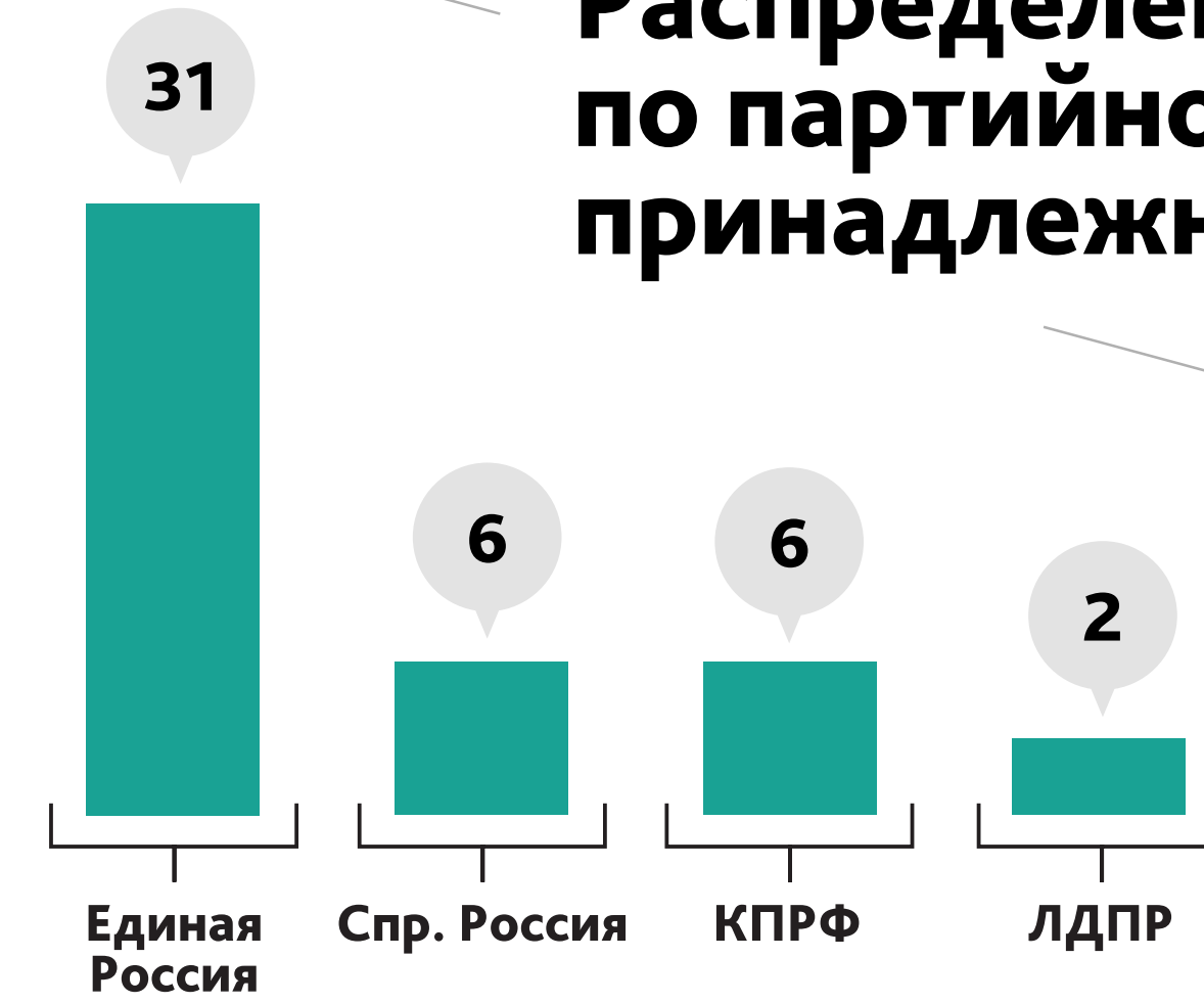
Распределение по партийной принадлежности